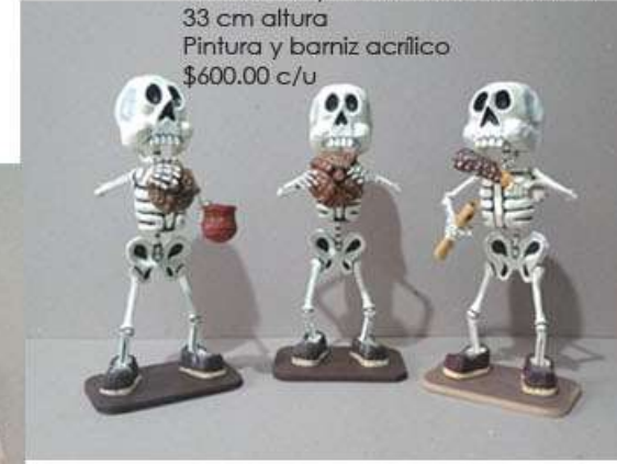
Tragones Cartonería y estructura de alambre 33 cm altura Pintura y barniz acrílico $600.00 c/u