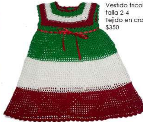
Vestido tricolor talla 2-4 Tejido en crochet $350