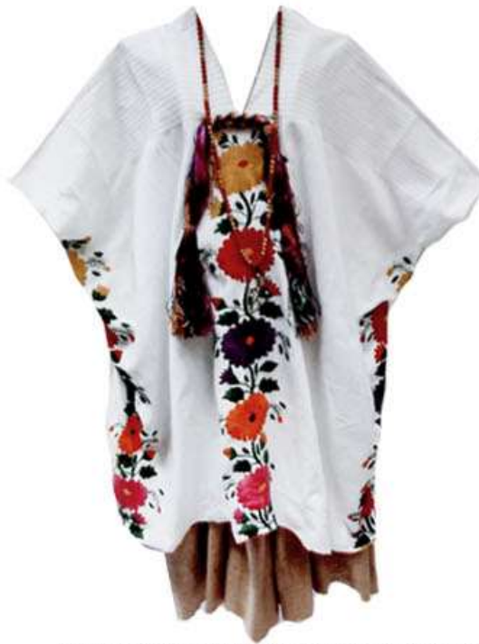
Huipil de gala, en telar de cintura, con cuatro hileras de bordado a mano, articela que lleva al frente y atrás es desmontable $3,500 Falda o enredo, en telar de cintura $2,000