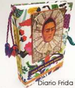
Diario Frida Flores 130 hojas, sobres, folders. Medidas: 14.5x22x4.5 cm $280