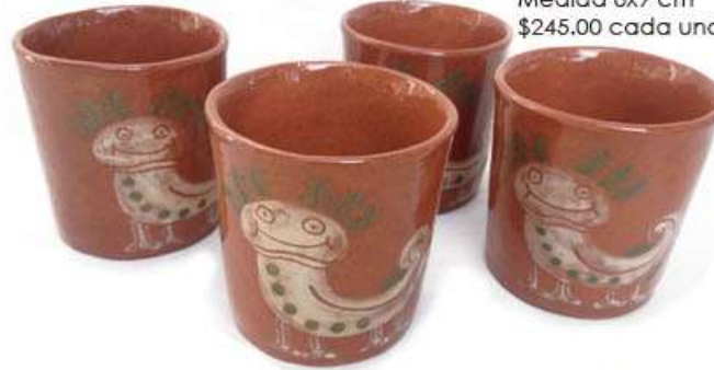
Vaso Axolote. Barro, engobes y esmalte. Medida 8x9 cm $245.00 cada uno