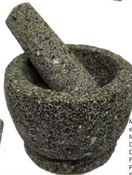
Mortero con base en piedra volcánica Medidas: Alto 7 cm Diametro exterior 9 Diametro interior 6.3 Profundidad 3.5 Peso 0.8 kg Precio $130