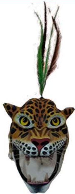
Máscara de Guerrero Jaguar sin cráneo $1200.00 con cráneo $1800.00 cartonería y pintura acrílica 34 x 19 cms. No incluye plumas largas.