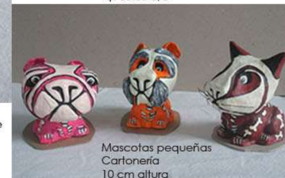
Mascotas pequeñas Cartonería 10 cm altura Pintura y barniz acrílico $150.00 c/u