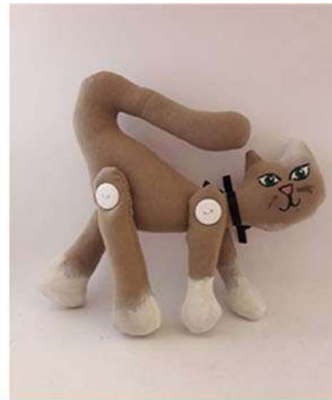
Gatos nichóstomo articuladas Retacitos 20 x 20 x 5 cm 150 gr. Aprox Tela sintética y manta, relleno de plástico PET reciclado, pintura acrílica $300