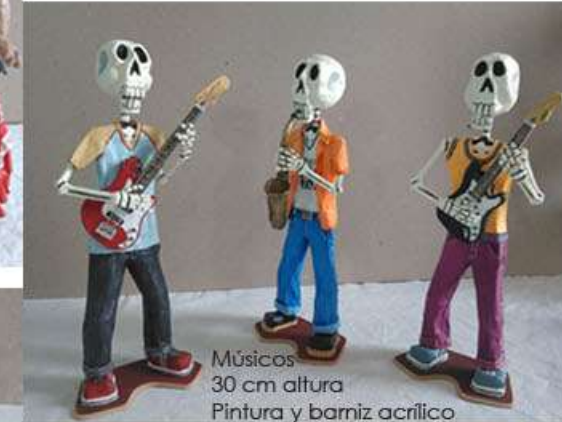
Músicos 30 cm altura Pintura y barniz acrílico $700.00 c/u