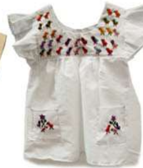
Bata para niña. Bordado a mano de figuras de pollitos, flores y mariposas. Talla 1 $200