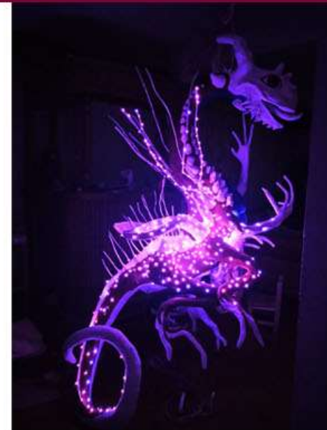
Alebrijes en cartonería sobre pedido Se puede incluir iluminación LED