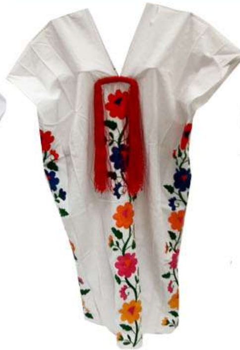
Huipiles de manta. Bordados a mano $850