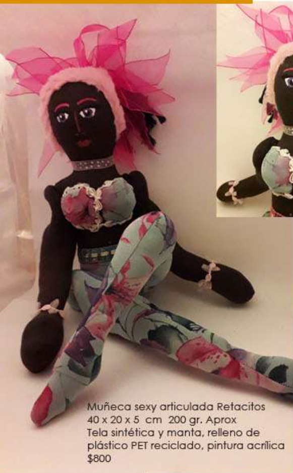
Muñeca sexy articulada Retacitos 40 x 20 x 5 cm 200 gr. Aprox Tela sintética y manta, relleno de plástico PET reciclado, pintura acrílica $800