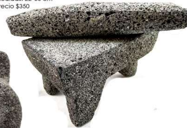
Metate Medidas: 22*30 cm Precio $350