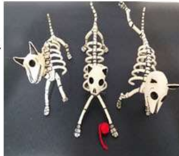
Perros y gatos. Estructura de 30 cms. El tamaño depende de la posición de cada uno. $320.00 c/u.