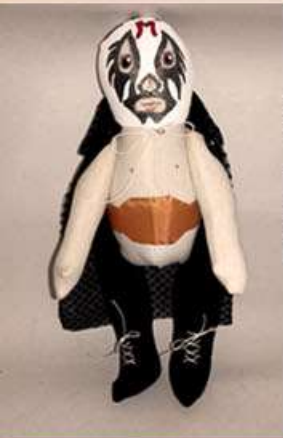
Luchador Gordo Retacitos 30 x 10 x 5 cm 150 gr. Aprox Tela sintética y manta, relleno de plástico PET reciclado, pintura acrílica $500