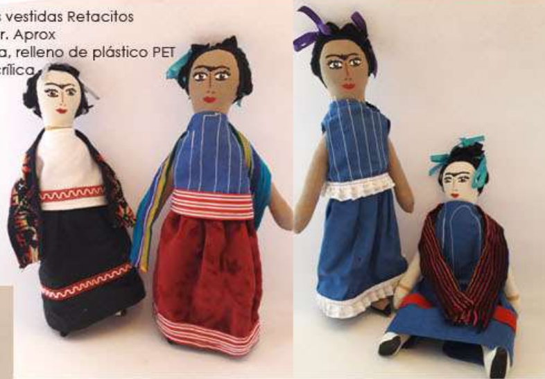
Muñecas articuladas vestidas Retacitos 30 x 10 x 5 cm 150 gr. Aprox Tela sintética y manta, relleno de plástico PET reciclado, pintura acrílica $500