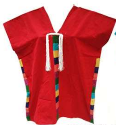
Blusa Yalalag, con bordado al estilo antiguo con cuatro hileras de bordado a mano $650