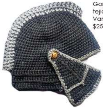
Gorro tipo casco romano tejido en crochet Varios colores $250