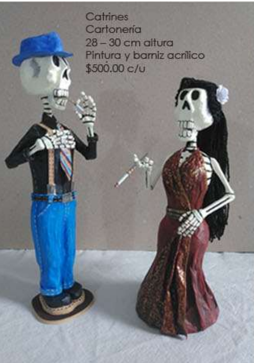
Catrines Cartonería 28 - 30 cm altura Pintura y barniz acrílico $500.00 c/u