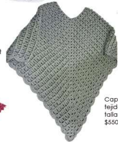
Capa gris tejido en crochet talla grande $550