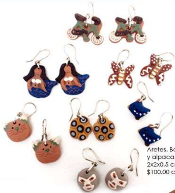
Aretes. Barro, engobes y alpaca. Medidas 2x2x0.5 cm $100.00 cada par