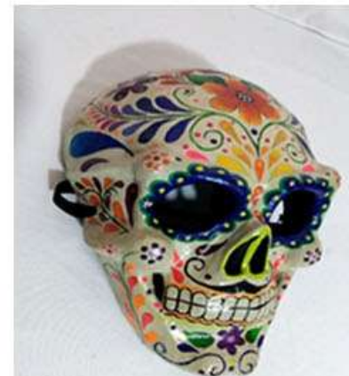
Máscara calavera colorida. Cartonería y pintura acrílica 28 x 18 cms. $800.00