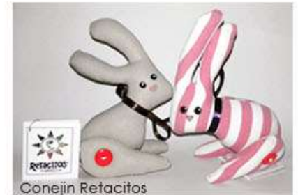
Conejín Retacitos 3 x 5 x 5 cm 50 gr. Aprox. Tela sintética y manta, relleno de plástico PET reciclado, pintura acrílica $120