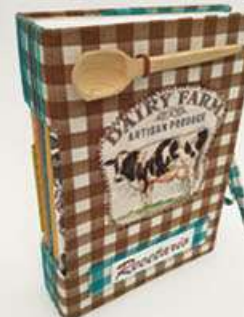
Recetario Vaca 130 hojas, sobres, folders. Medidas: 14.5x22x4.5 cm $280