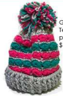
Gorros multicolores Tejido crochet punta caraco $150