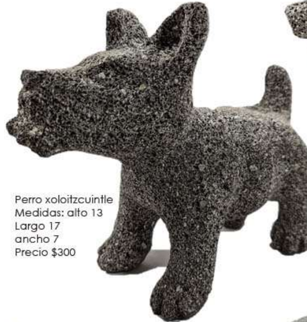
Perro xoloitzcuintle Medidas: alto 13 Largo 17 ancho 7 Precio $300