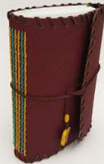
Cuaderno Vino imitación piel, forro estampado interior buhos, porta pluma 120 hojas bond. Medidas: 14.5x22x3 cm $250