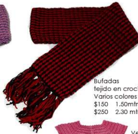
Bufadas tejido en crochet Varios colores $150 1.50mtrs. $250 2.30 mtrs.