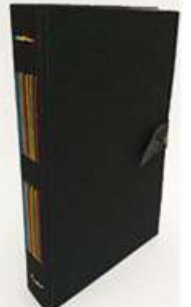
Cuaderno Negro 120 hojas bond. Medidas: 14.5x22x3.5 cm $200