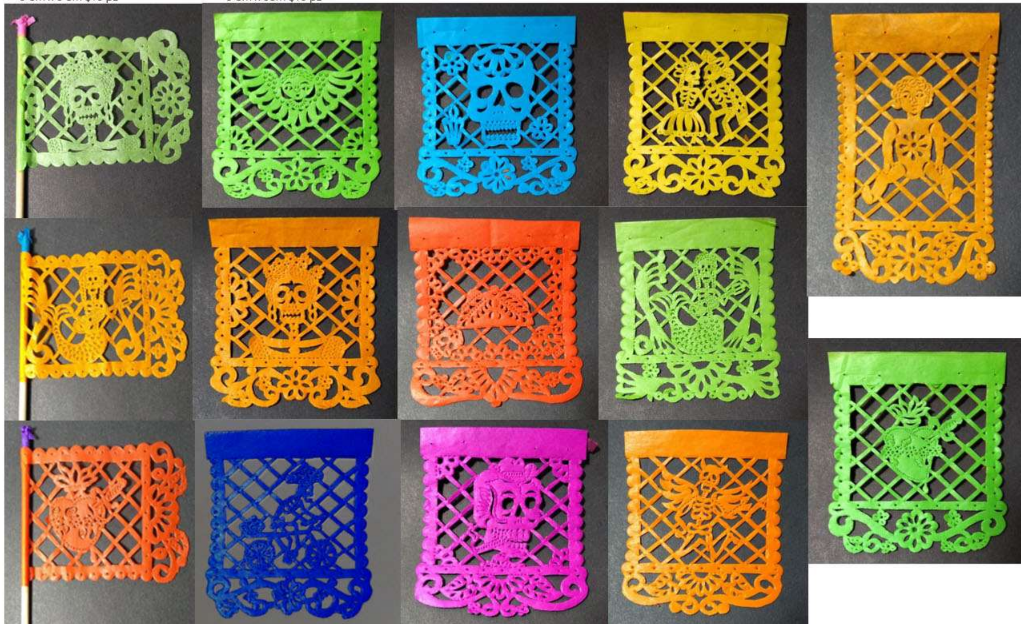
Cendales 5 cm x 6cm $15 pz