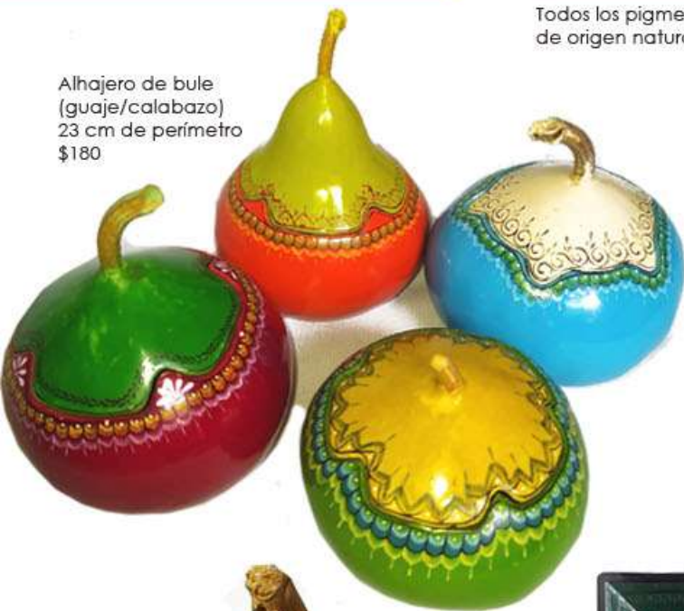
Alhajero de bule (guaje/calabazo) 23 cm de perímetro $180