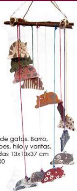
Móvil de gatos. Barro, engobes, hilo y varitas. Medidas 13x13x37 cm $335.00