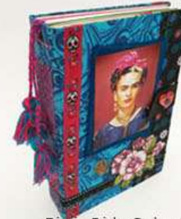
Diario Frida Calaveras 130 hojas, sobres, folders. Medidas: 14.5x22x4.5 cm $280