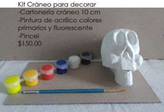
Kit Cráneo para decorar -Cartonería cráneo 10 cm -Pintura de acrílico colores primarios y fluorescente -Pincel $150.00