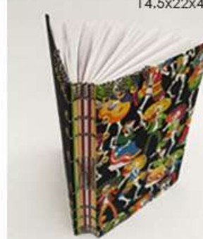
Cuaderno Calaveras Mariachi 120 hojas bond. Medidas: 14.5x22x3 cm $250