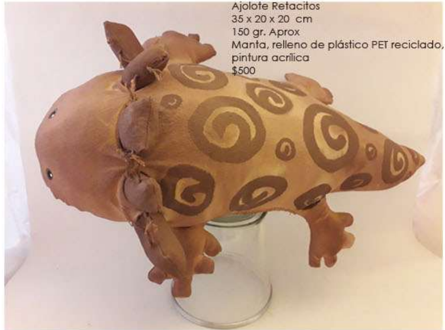
Ajolote Retacitos 35 x 20 x 20 cm 150 gr. Aprox Manta, relleno de plástico PET reciclado, pintura acrílica $500