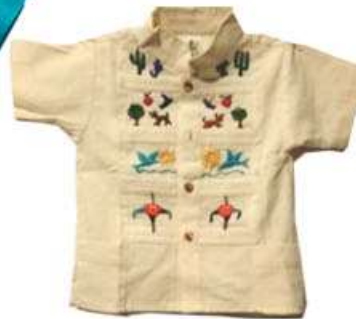
Guayabera de niño bordados a manos Talla 6 $250