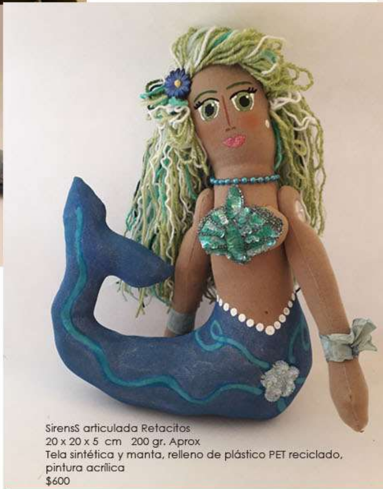
Sirenas articulada Retacitos 20 x 20 x 5 cm 200 gr. Aprox Tela sintética y manta, relleno de plástico PET reciclado, pintura acrílica $600

Cada pieza es única. Nos comprometemos a entregarte el mismo tamaño, proporción y calidad. Los colores pueden variar.