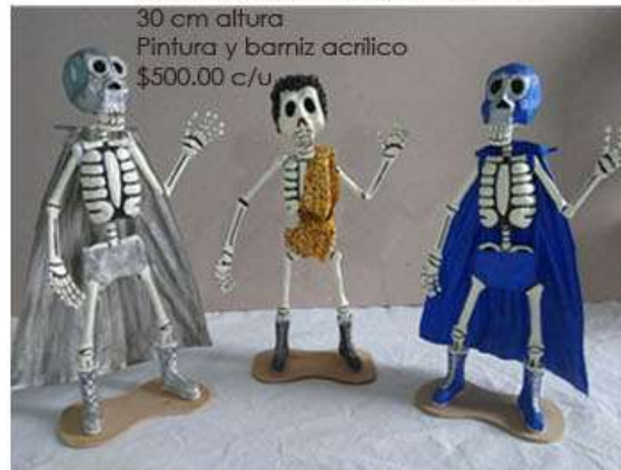
Luchadores Cartonería, estructura de alambre 30 cm altura Pintura y barniz acrílico $500.00 c/u