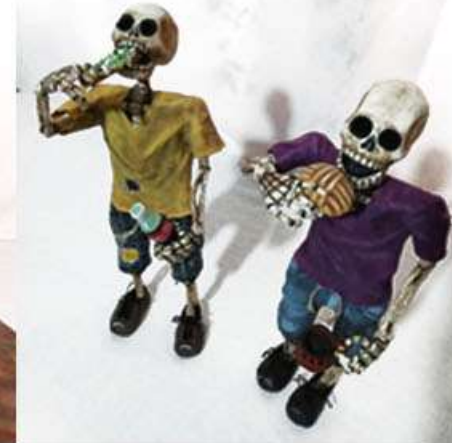
Esqueletos tragones Cartonería y pintura acrílica 40 cms. $1200.00 c/u.