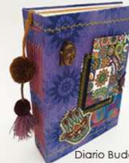
Diario Buda 130 hojas, sobres, folders. Medidas: 14.5x22x4.5 cm $280