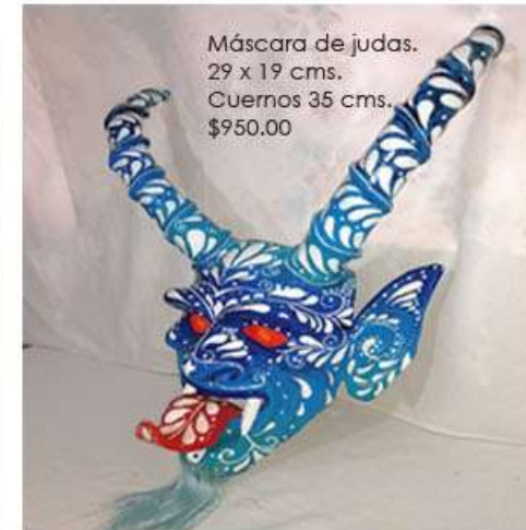
Máscara de judas. 29 x 19 cms. Cuernos 35 cms. $950.00