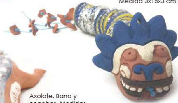
Cochocoatl. barro, engobes y corcholatas. Medida 3x15x3 cm $190.00