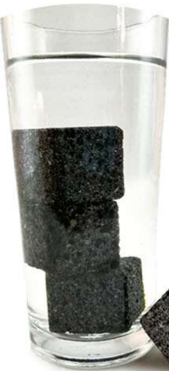
Cubos de piedra Contamos con dos diseños a elegir, los comales lisos y los comales rayados, otro producto que aporta grandes beneficios son los cubos de piedra que como su nombre lo dice asemeja la forma de un cubo de hielo, estos poseen propiedades preventivas y cuentan con dos funciones principales: 1.- Enfriar bebidas 2.- Agua alcalina: a. Medidas: 2.5* 2.5 cm Precio $15 cada uno