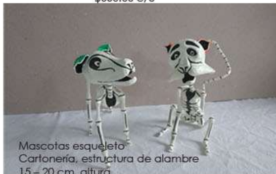
Mascotas esqueleto Cartonería, estructura de alambre 15 - 20 cm. altura Pintura y barniz acrílico $300.00 c/u