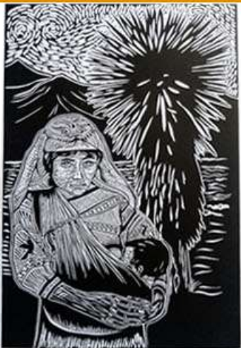
Grabados en linóleo 30 x 40 cm papel soundansfelt $470 c/u