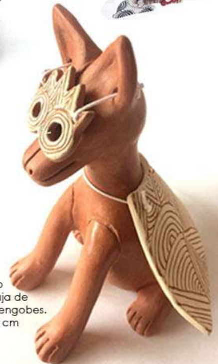
Chilanguillo Xolito Luchador con caja de madera. Barro y engobes. Medidas 10x7x13 cm $650.00