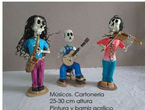
Músicos. Cartonería 25-30 cm altura Pintura y barniz acrílico $600.00 c/u