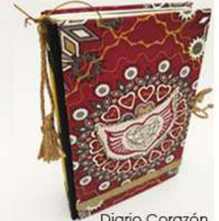
Diario Corazón 130 hojas, sobres, folders. Medidas: 14.5x22x4.5 cm $280