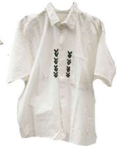
Camisas de manta y bordado a mano con distintas figuras. $300