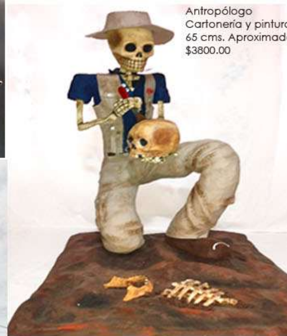
Antropólogo Cartonería y pintura acrílica 65 cms. Aproximadamente. $3800.00