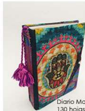
Diario Mano 130 hojas, sobres, folders. Medidas: 14.5x22x4.5 cm $280