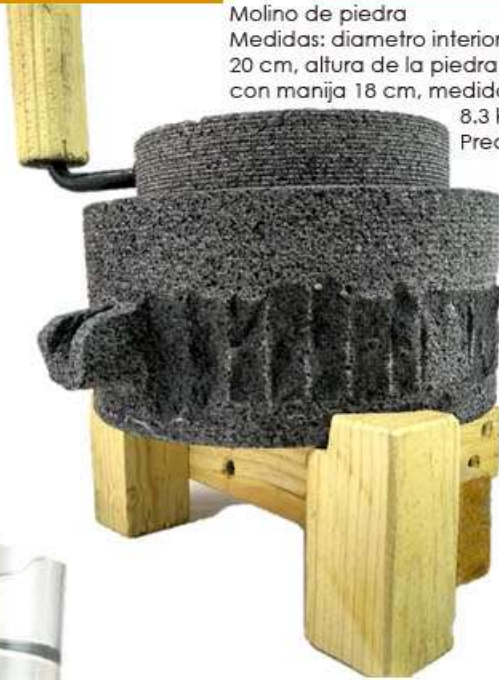
Molino de piedra Medidas: diametro interior 15.5 cm, diametro exterior 20 cm, altura de la piedra base 10 cm, altura total con manija 18 cm, medida total con base y peso de 8.3 kg Precio $650