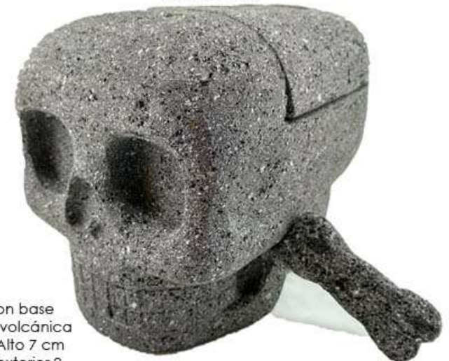
Molcayete de cráneo con tapa $450, Materia: Piedra volcánica , Alto 14.5 cm Ancho 14 cm Grosor 20 Peso 6 Kg