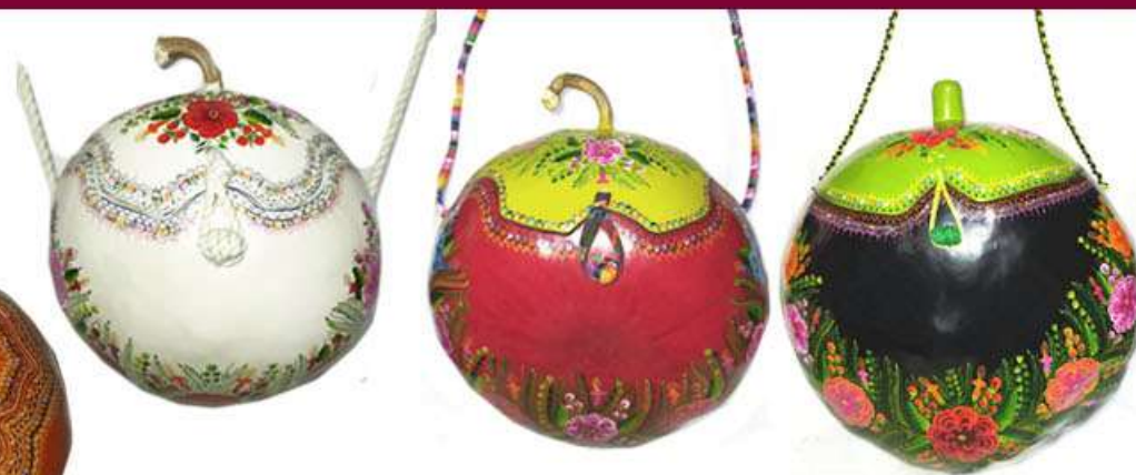
Bolzos de bule (guaje/calabazo) 75 cm de perímetro $1,200