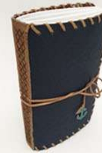
Cuaderno Ancla, imitación piel, forro interior peces lomo y costura en gamuza, 120 hojas bond. Medidas: 14.5x22x3.3 cm $250