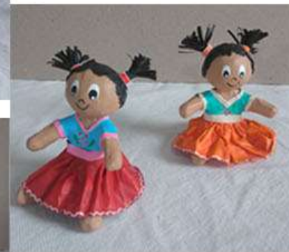
Cuetitos/muñecas Cartonería, estructura de alambre 9 cm altura Pintura y barniz acrílico $ 150.00 c/u