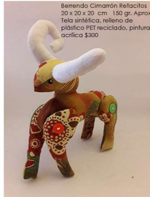
Berrendo Cimarrón Retacitos 20 x 20 x 20 cm 150 gr. Aprox Tela sintética, relleno de plástico PET reciclado, pintura acrílica $300