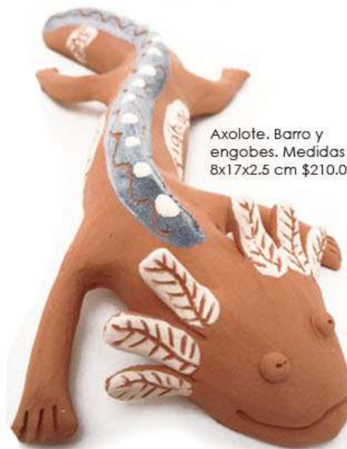
Axolote. Barro y engobes. Medidas 8x17x2.5 cm $210.00