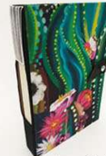
Cuaderno Cactus 120 hojas bond. Medidas: 14.5x22x3 cm $200