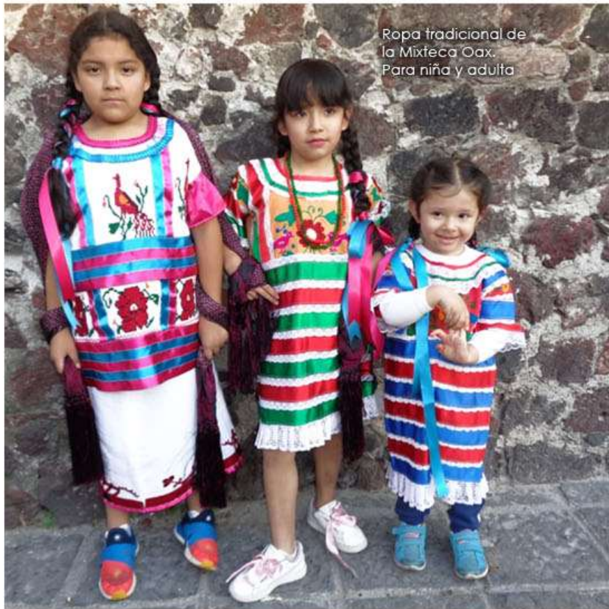
Ropa tradicional de la Mixteca Oax. Para niña y adulta