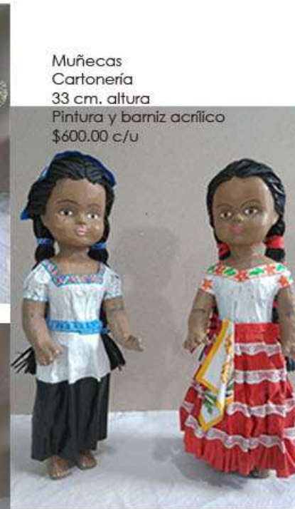
Muñecas Cartonería 33 cm. altura Pintura y barniz acrílico $600.00 c/u