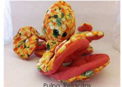
Pulpo Retacitos 30 x 30 x 30 cm 150 gr. Aprox Tela sintética, relleno de plástico PET reciclado, pintura acrílica $400