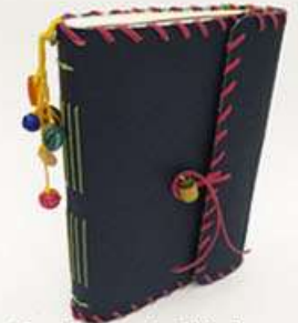
Cuaderno Azul Marino imitación piel, forro estampado interior mandalas, porta pluma 120 hojas bond. Medidas: 14.5x22x3 cm $250