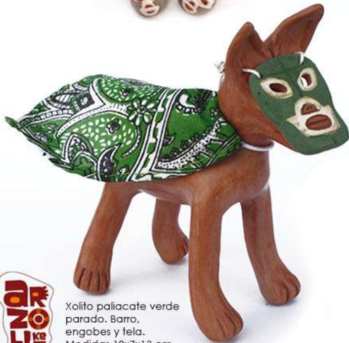
Xolito paliacate verde parado. Barro, engobes y tela. Medidas 10x7x13 cm $450.00