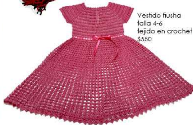
Vestido fiusha talla 4-6 tejido en crochet $550