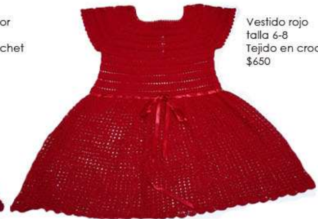
Vestido rojo talla 6-8 Tejido en crochet $650